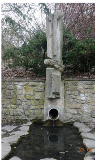
Prameniště Prokopského potoka

Kuba nás od odpočívadla vede nahoru, kde pod kopečkem zajdeme zkontrolovat, zda je pravda, že zde začíná pramen