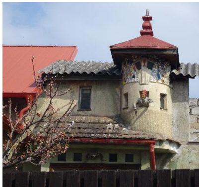
Dům na ulici Za Lužinami č.p. 92/10

Vedla tudy Královská cesta z Pražského hradu na hrad Karlštejn. Kolem kostela se rozkládalo panství svatovítského probošta s lesy, loukami, poli a malou tvrzí. Ta stávala v dnešní ulici K Brance , kterou nás dnes Kuba také povede.