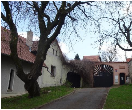
Strom Olgy Havlové – kaštanovník jedlý

Všimněte si starých původních opravených domečků, např. čp. 45/6, 52/10.