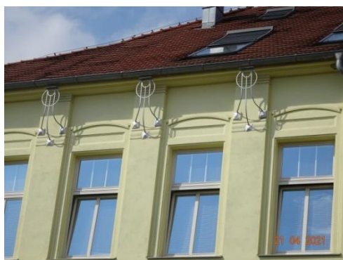
ZŠ Mláďí, kde z boku najdete hledaný nápis

Vezměte si mapku a jdeme se konečně projít. Obejdeme KD Mlejn a jdeme kolem prodejny Kely rovně stále ulicí Mláďí kolem ZŠ Mláďí. Počátkem 20. stol narůstal počet dětí, stará školička nestačila, proto se začala stavět nová. V r.1908 byla postavena a přivítala první žáčky. Ve své době to byla nejhezčí školní budova v okrese.