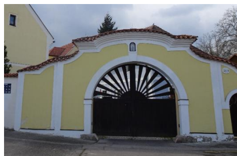
Jeden z původních statků

Václav Pícha z č. 1 odešel s manželkou Rozinou a další. Několik statků se dochovalo dodnes. Jsou především kolem kostela. Také vás tam dnes Kuba zavede